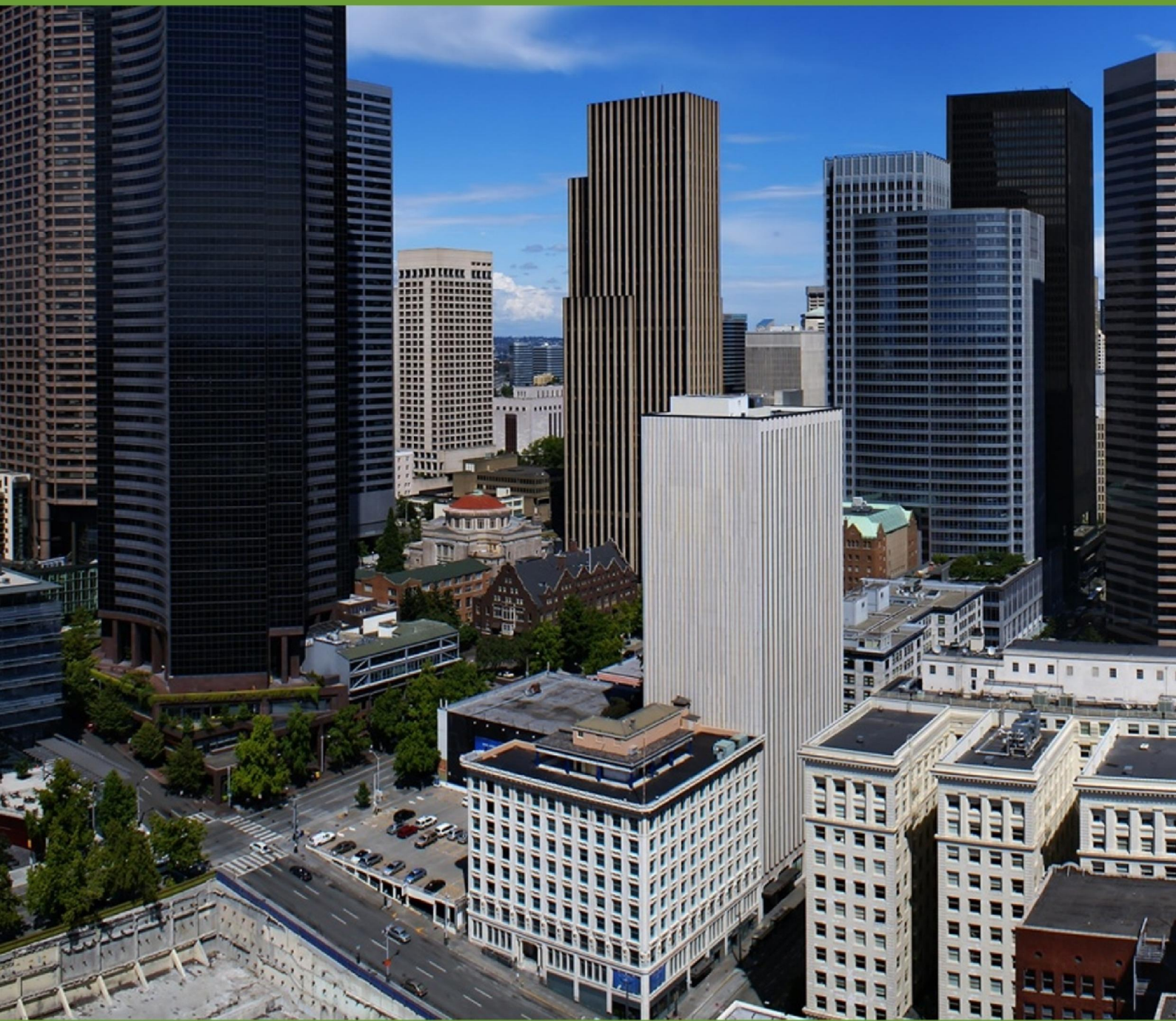
ออกแบบปก : ศุภาโชค ศรีรัตนศิลป์