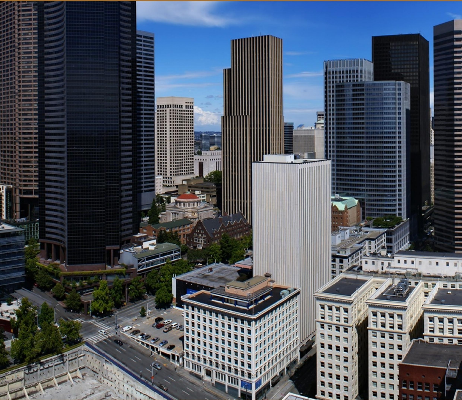
ออกแบบปก : ศุภโชค ศรีรัตนศิลป์