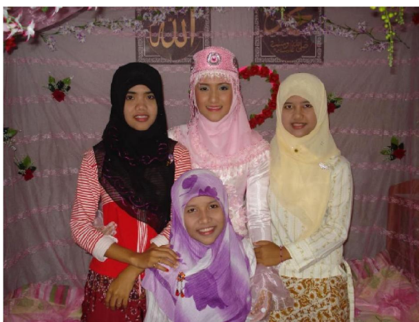
ภาพแสดงตัวอย่างการแต่งกายสตรีมุสลิม

การแต่งกาย ผู้หญิงมุสลิม แต่งกายมิดชิด มีผ้าคลุมร่างกาย ซึ่งแต่ละชาติอาจแตกต่างกันบ้างในรายละเอียด